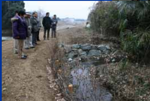
シンポジウムと エクスカージョンの様子