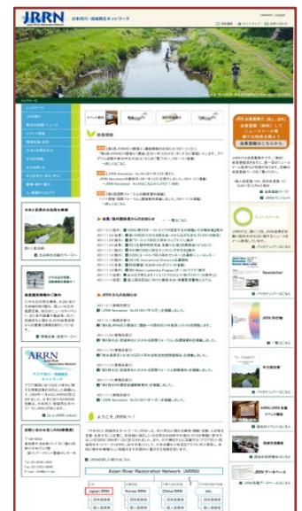
JRRN ホームページによる情報循環