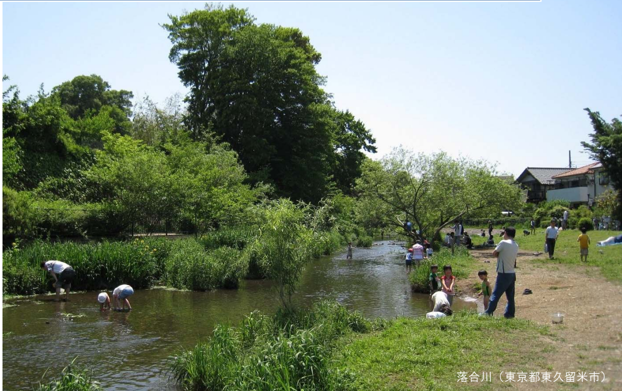
落合川（東京都東久留米市）