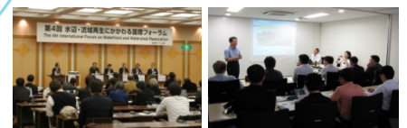
JRRN 主催イベントでの会員交流