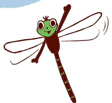
ヒヌマイトトンボ Mortonagrion hirosei (トンボ目)